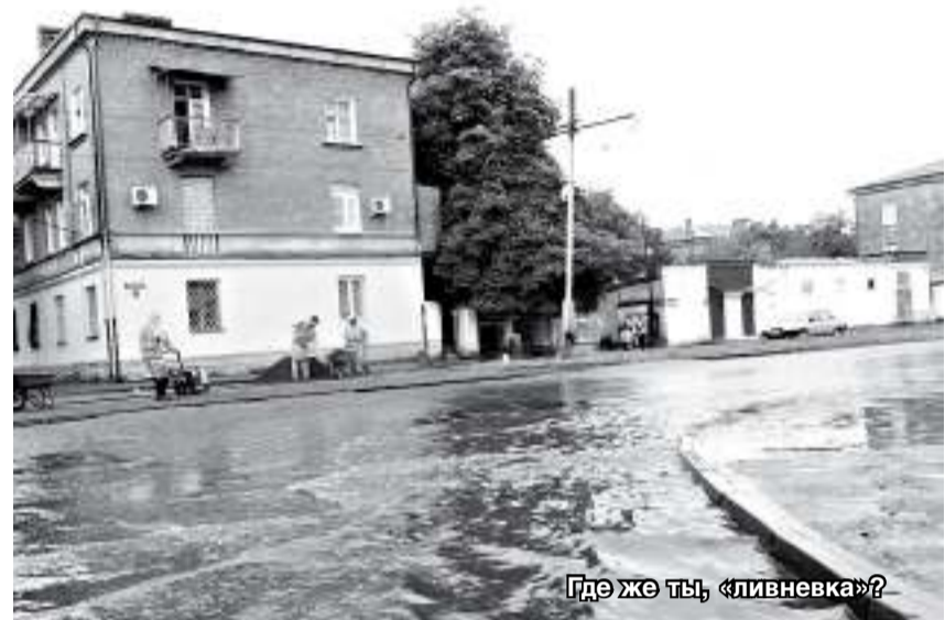
Где же ты, «ливневка»?

При замене межрельсового настила на ул. Плиева и Кирова на бетонные плиты городские структуры, отвечающие за приемку работ, уверяли нас, что участок на гарантии. При этом ни одна