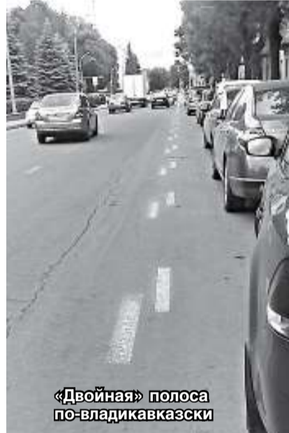
«Двойная» полоса по-владикавказски

сового настила трамвайных путей и ливнеприемных колодцев: из года в год органами Госавтоинспекции выдаются предписания о необходимости проведения работ по их ремонту, за невыполнение которых должностным лицам принимаются меры административного воздействия.